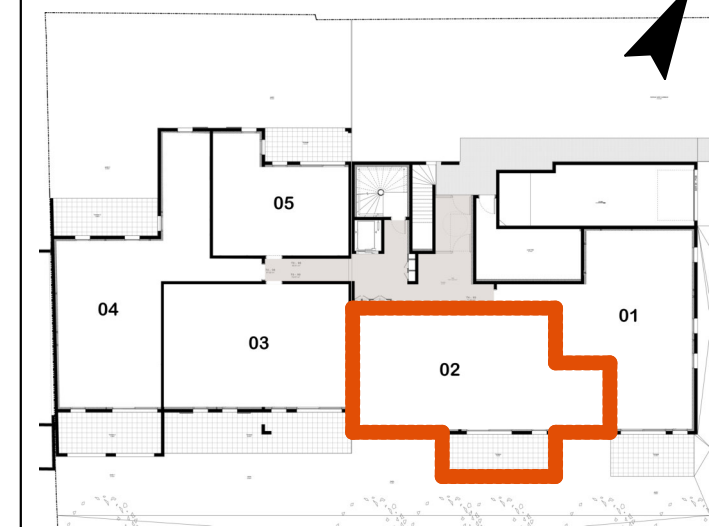
Appartement n° 02 RDJ